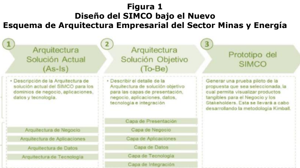
Ilustración 2 - Fases del proyecto de Arquitectura Objetivo de la Solución

Con el Decreto 2573 de 2014, se da inicio a la remodelación del sistema de información SIMCO acorde con nuevas metodologías y siguiendo los lineamientos de Ministerio de Tecnologías de la Información y las Comunicaciones-MinTIC. La propuesta del nuevo diseño queda lista en el año 2016 y contempla el desarrollo de las siguientes fases: i) Arquitectura Actual (As-Is); ii) Arquitectura Solución Objetivo (To Be); iii) Prototipo SIMCO, según se muestra en la Figura 1.